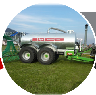
AGRAR Citernes en métal Citerne à pression et aspiration Citerne à pression à pompe Citerne-pompe