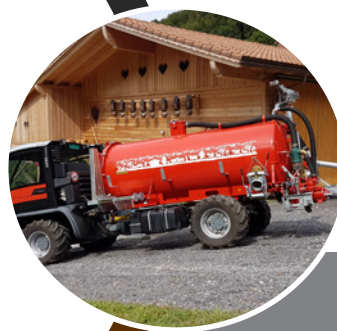
AGRAR Citernes à cuve Sur différents véhicules porteurs