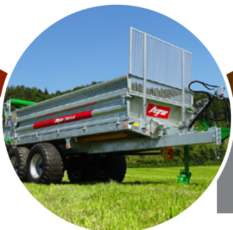
AGRAR Épandeurs de fumier Autochargeuse surbaissée Autochargeuse surélevée

Grâce à des systèmes d'épandage tournés vers l'avenir, des châssis de roulement respectueux du sol et des systèmes de pompe les plus divers, les produits de la technique des engrais de ferme Agrar ont déjà convaincu des milliers d'agriculteurs et des entreprises de travaux agricoles suisses de leur fiabilité, de leur qualité et de leur longévité.